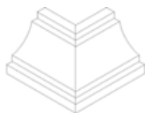
Coin extérieur réf.175