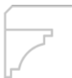
Petite moulure réf.155

Coloris disponibles (cf pages précédentes) : 3 – 1051 – 1052 – 1053 – 1054 – 1057 – 1156 – 1158 – 1159 – 5318 – 5319 – 5321 – 5322