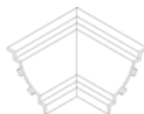
Coin intérieur réf.176